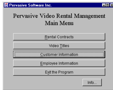
図 1 PSQL PVideo サンプル アプリケーションのメイン ウィンドウ - Java